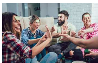
Apéro-Sources : Porrentruy, 3 mars