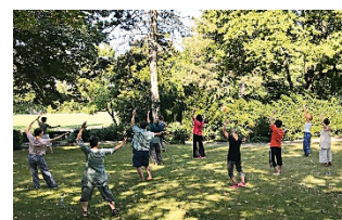
Shibashi : Les Tilleuls, le 3 mars