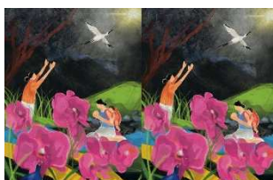
Journée Mondiale Prière : Les Sources, le 3 mars