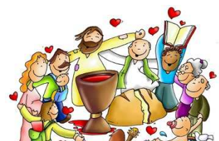
Célébrations familiales : 25-26 février, 4-5 mars