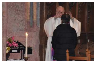
Recevoir le pardon pendant le carême