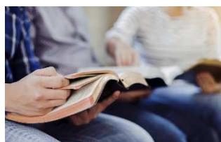
Groupe biblique : Courtedoux, le 15 mars