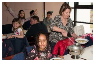
Soupes de carême dans l'Espace pastoral