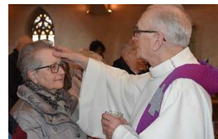
Recevoir l'onction des malades