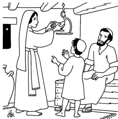
La vie à Nazareth

4 ème sens : le toucher (par les câlins des parents)