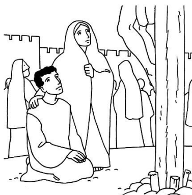
Au pied de la croix

Quand Jésus a 30 ans, il se fait baptiser par Jean Baptiste. Puis il est invité à un mariage à Cana ; sa mère est là et quelques-uns de ses amis. Il y a tellement de monde que le vin manque. Attentive, Marie s'en aperçoit et le signale à son fils. Elle veut tirer les mariés de l'embarras. Elle a confiance en Jésus et elle a raison. Elle dit aux serviteurs : « Faites tout ce qu'il vous dira ( Il= c'est Jésus) ». Et Jésus change l'eau en vin : à la demande de sa mère, Jésus accomplit son premier miracle. (Jn 2, 1-12)