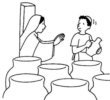
Les Noces de Cana

5 ème sens : le goût (par les fruits du pays de Jésus : dattes ; figues ; raisin ; amandes ; noix + pain pitta)