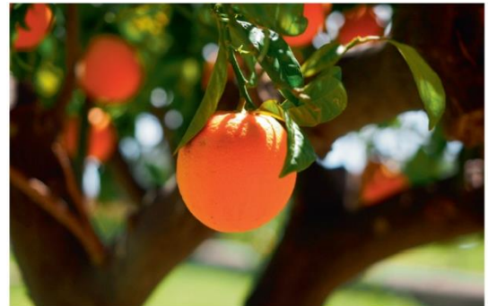
Chaque arbre, son fruit

Quel disciple sommes-nous ? Cherchons-nous à être au-dessus du Maître ? Désirons-nous être comme lui ? Désirons-nous plutôt le laisser vivre en nous sa vie de ressuscité ? Lui seul peut nous évangéliser pour lui donner un visage dans notre monde en quête de sens et de bonheur.