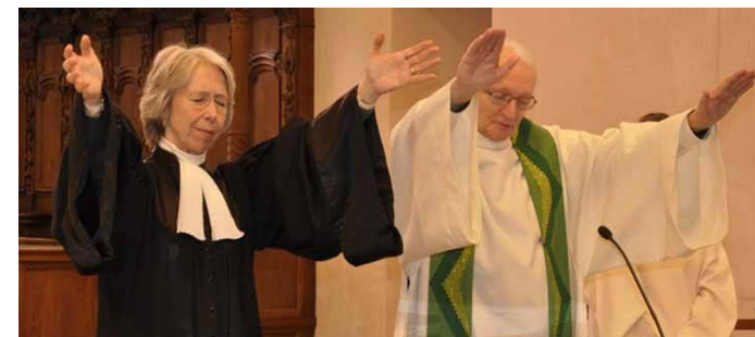
SEMAINE DE PRIÈRE POUR L'UNITÉ CHRÉTIENNE Dimanche 20 janvier, 10h, célébration œcuménique à St-Pierre

Autres célébrations œcuméniques en Ajoie - Clos du Doubs