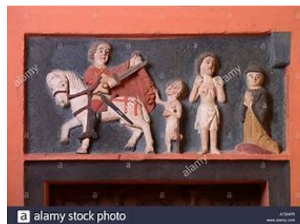
St-Martin a partagé son manteau avec un déshérité transi de froid